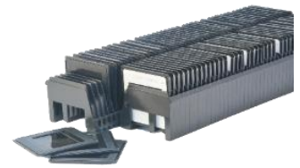
€ je Dia inkl. MwSt.

Wünschen Sie optionale Zusatzleistungen ?