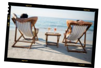
€ je Bild | inkl. MwSt.

Wünschen Sie optionale Zusatzleistungen?